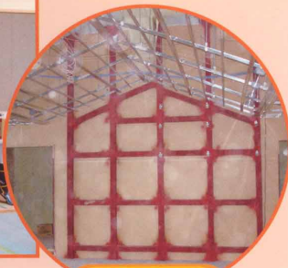
兵庫 魚崎ロングステージ COCORO 保育園 (幅 3.6m) 鉄骨下地