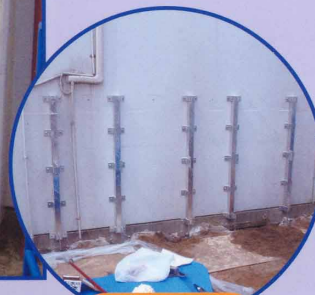
兵庫・尼崎 うしお保育園 (幅 5.32m × 高さ 1.8m) カーブパネル IN と OUT カーブを利用してウェーブデザイン (垂直)